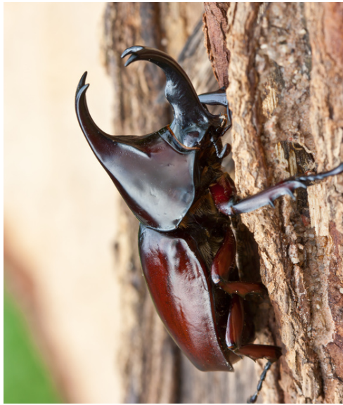
le scarabée rhinocéros