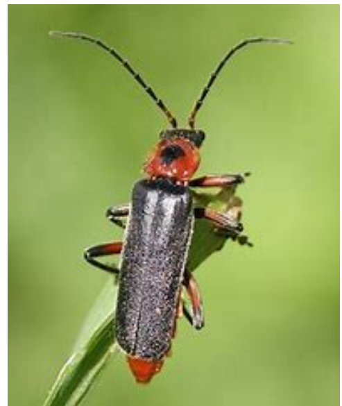
le téléphore moine