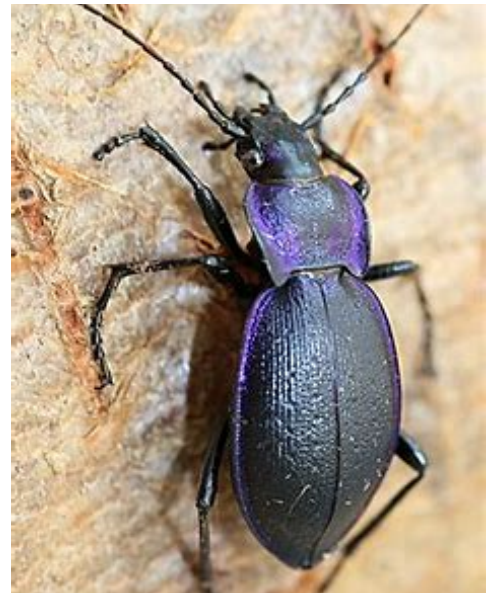
le carabe violet