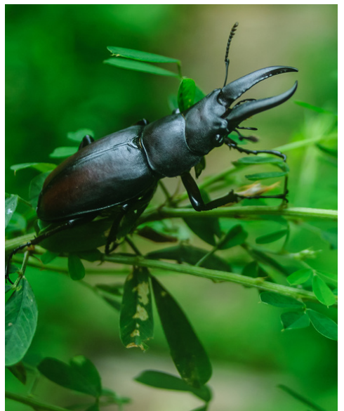
le lucane cerf-volant