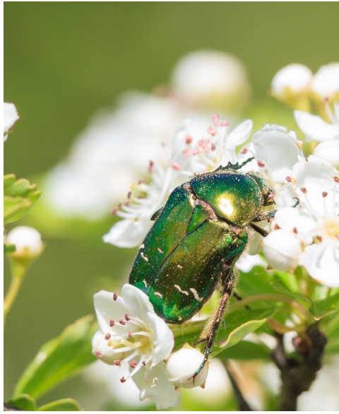
la cétoine dorée