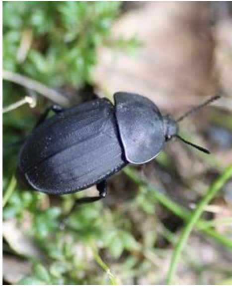
le silphe obscure