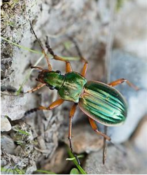
le carabe doré